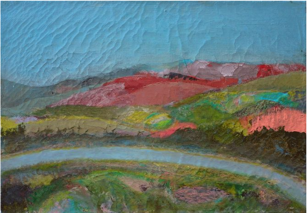
gene barbe summerwork 2018 from caunes-minervoies