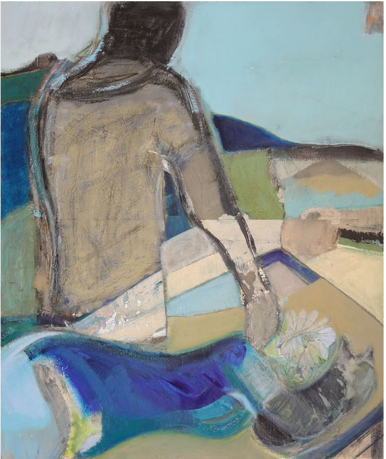
good morning 1m20x1m/39'x47'