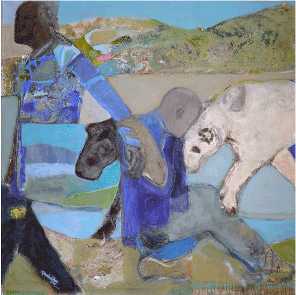
passages (inclusif) 1m60x1m60 / 63'x63'