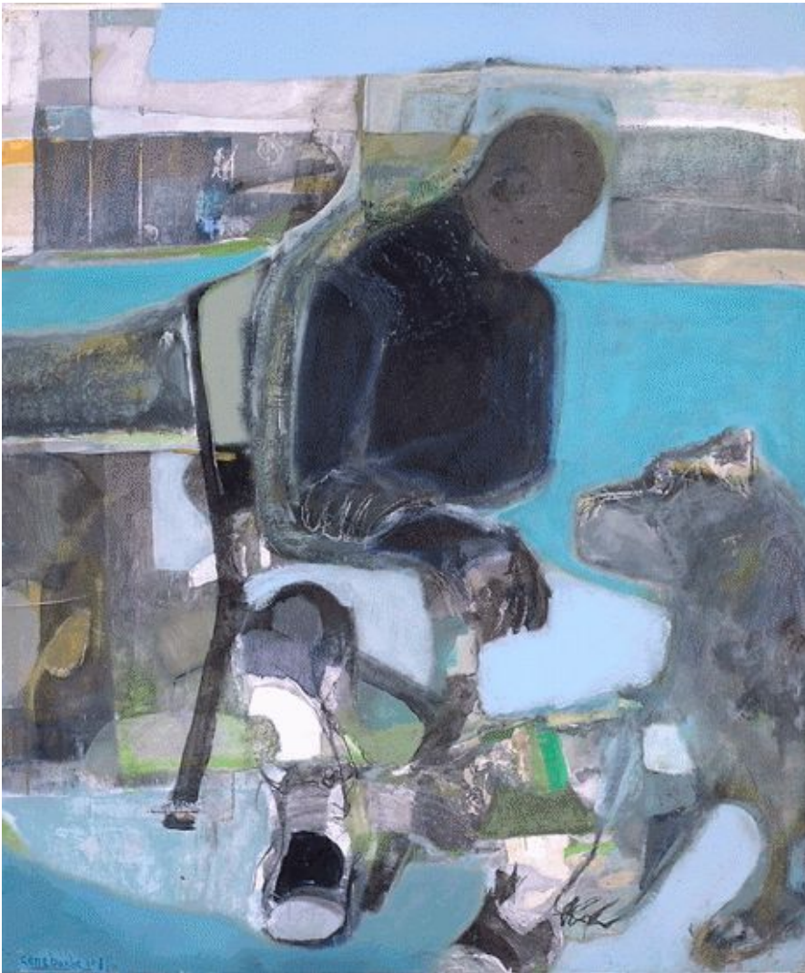
apparitions 130x110cm/51"x43" (ex valley 2013)